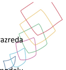
TABELARNI PRIKAZ UVJETA I DOKUMENTACIJE TEMELJEM KOJE SE DOKAZUJE ISPUNJENJE UVJETA